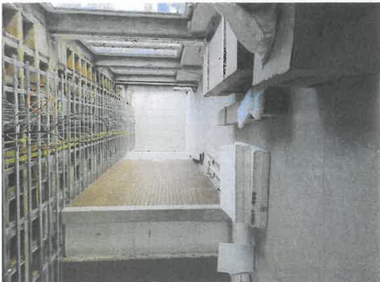
Flur Riegel 3