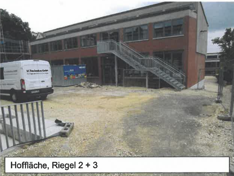
Hoffläche, Riegel 2 + 3