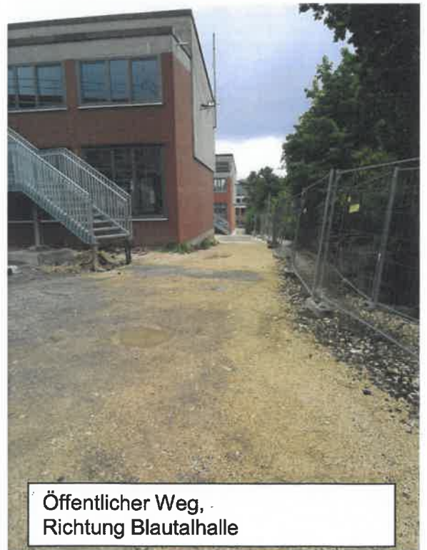
Öffentlicher Weg, Richtung Blautalhalle