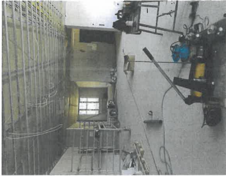
Neubau - Verwaltung