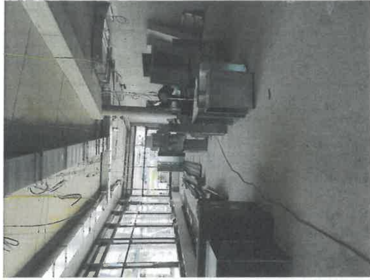
Neubau - Mensa