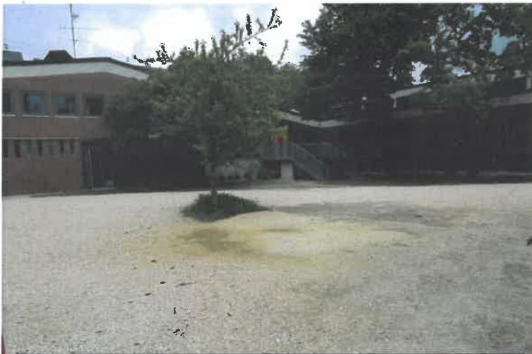
Hoffläche, Riegel 1 + 2