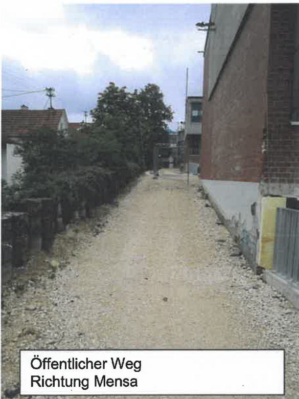
Öffentlicher Weg Richtung Mensa