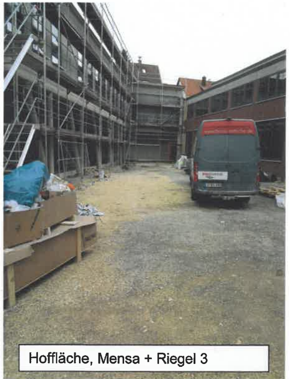
Hoffläche, Mensa + Riegel 3